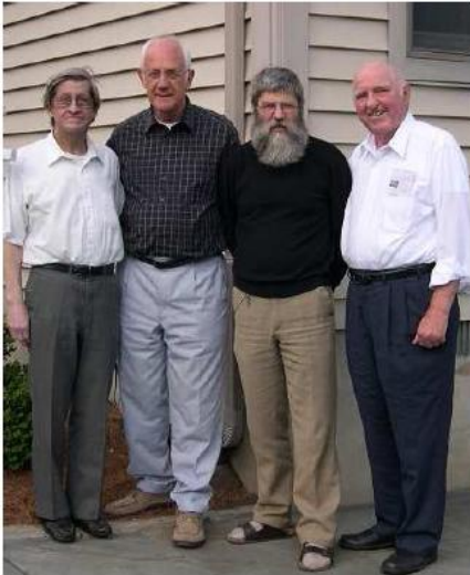
2007 en Liberty Corner, NJ, EUA: